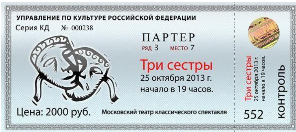
6. (Билет в театр)