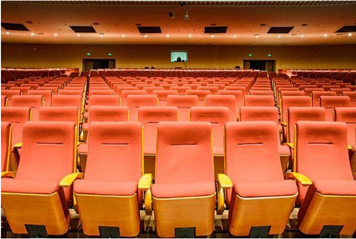
1. (зрительный зал)