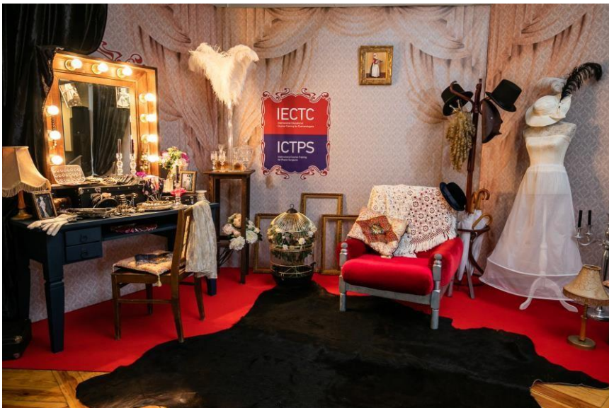
7. (Театральная гримёрка)