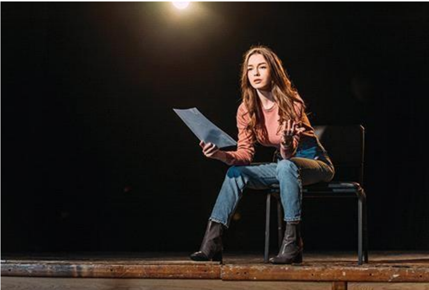
5. (актер, актриса)