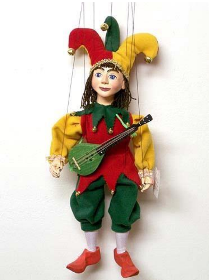
4. ( куклы марионетка)