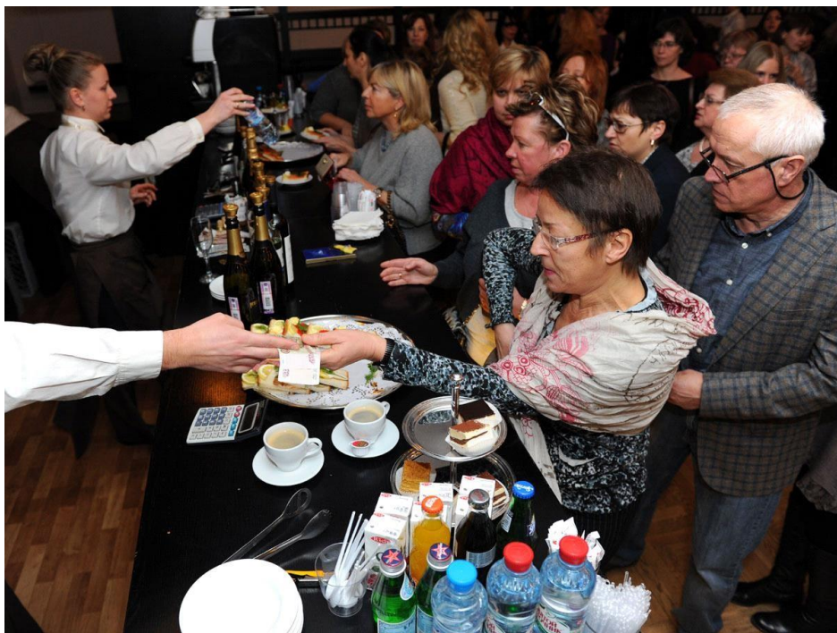
8. (Театральный буфет)