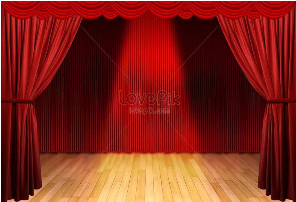
2. (сцена с кулисами)