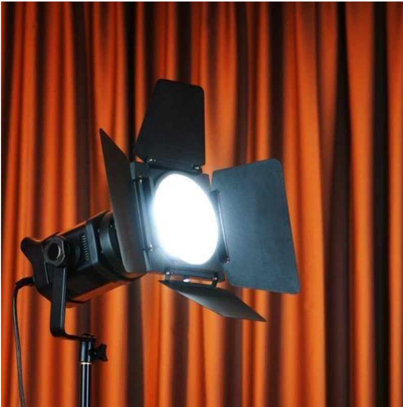
3. (театральный софит)