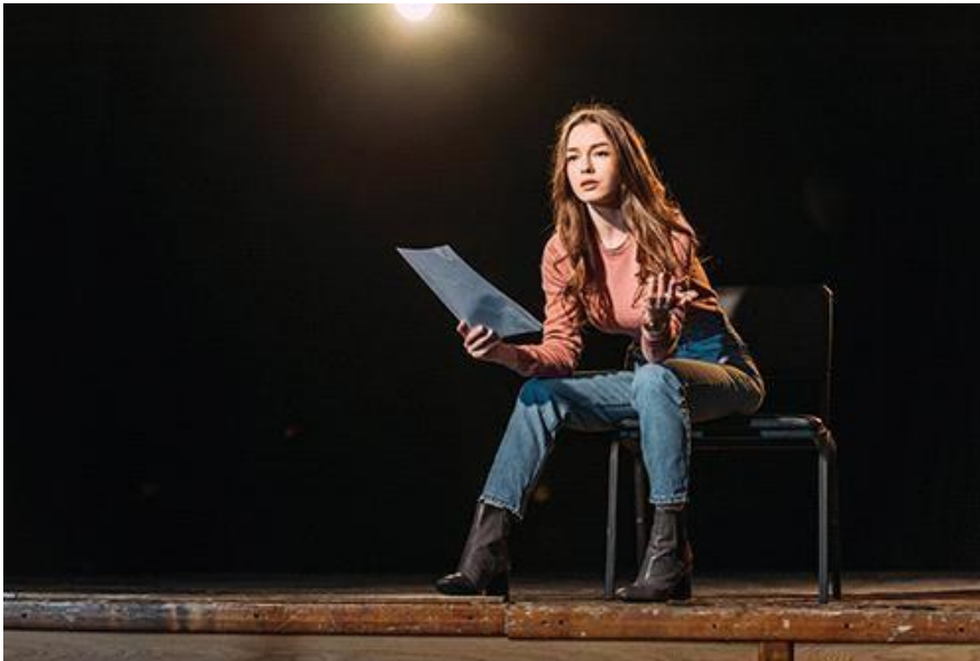
5. (актер, актриса)